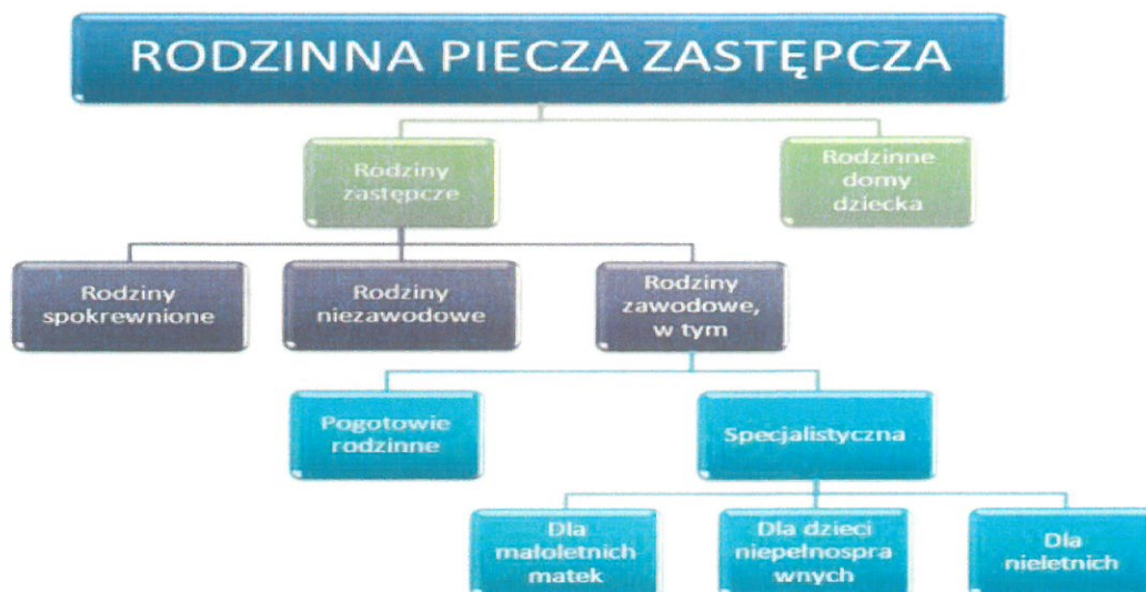
Rysunek 1: Schemat Rodzinnej Pieczy Zastępczej